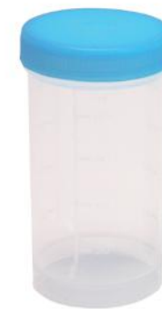
BUIZEN EN CONTAINERS